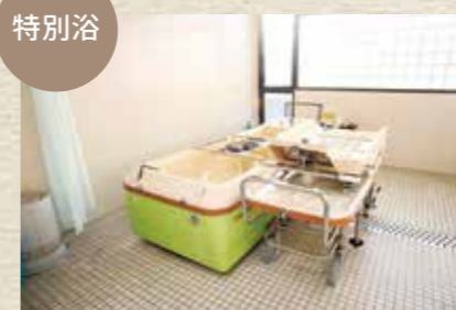
自力での入浴が困難な方のための特別浴のスペースです。