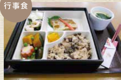
おいしく、楽しく、安全に。管理栄養士による適切な献立で、お一人おひとりに合わせた食事形態で提供します。