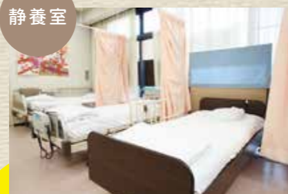
仕切りのあるプライベート空間でゆっくりお休みいただけます。