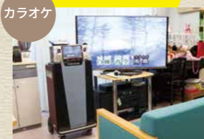
常に人気の高いレクリエーションです。大画面TVと通信カラオケでお好きな歌が必ず見つかります。