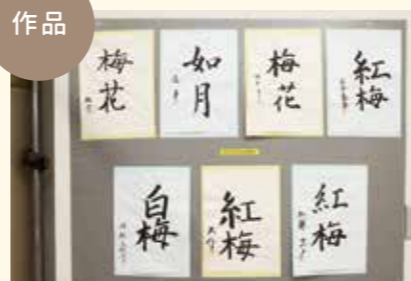
利用者様の力作です。外部での展示会にも参加しています。