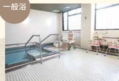
広い一般浴でゆっくりと入浴を楽しんでいただけます。