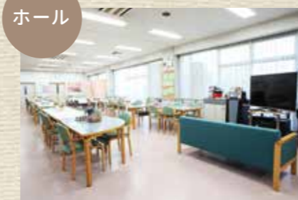
レクリエーションや行事もここでいきます。楽しく過ごしていただくことを心がけています。