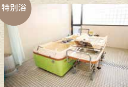
自力での入浴が困難な方のための特別浴のスペースです。