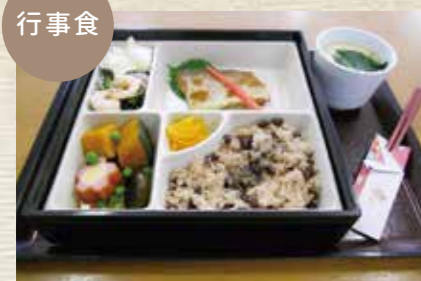
おいしく、楽しく、安全に。管理栄養士による適切な献立で、お一人おひとりに合わせた食事形態で提供します。