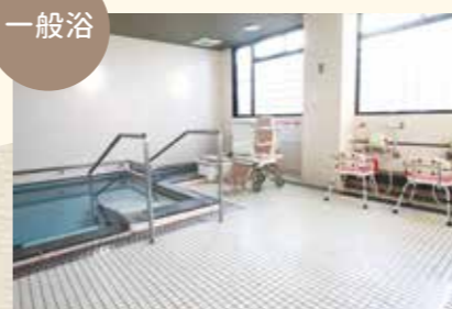
広い一般浴でゆっくりと入浴を楽しんでいただけます。