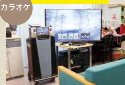
常に人気の高いレクリエーションです。大画面TVと通信カラオケでお好きな歌が必ず見つかります。