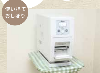
使い捨ておしぼり