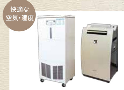
快適な空気・湿度

[2階] 大型空気清浄加湿器 ×2台設置 [3階] 全居室・ホール 空気清浄加湿器設置